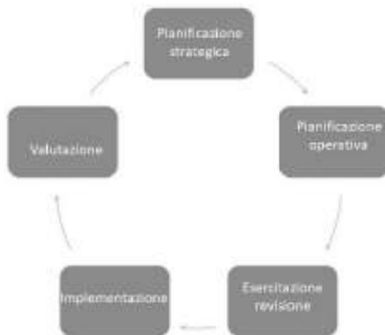
Figura 2. Elementi chiave del ciclo di pianificazione pandemico

Per questo, la prossima pandemia influenzale potrebbe differire da quanto pianificato ed è necessario sia preparare ed esercitare le capacità di risposta secondo schemi internazionali codificati e scenari attesi, sia rafforzare competenze di indagine e analisi che consentano rapidamente e con flessibilità durante la fase di allerta pandemica di adattare e modulare gli strumenti disponibili alle nuove contingenze. La preparedness delle pandemie influenzali, pertanto, si modula costantemente in base alle esperienze maturate e viene continuamente verificata e rafforzata nelle fasi inter-pandemiche in modo ciclico (Figura 2).