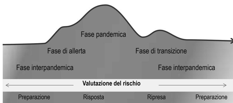
Figura 3. Andamento delle fasi pandemiche

Queste fasi potrebbero evolvere in tempi differenti in un determinato Paese a seconda della conformazione geografica o di altre caratteristiche legate all'epidemiologia dell'agente eziologico. Pertanto, il diagramma sopra esposto potrebbe apparire diversamente rappresentato a seconda che si esamini una singola regione o l'intero Paese.